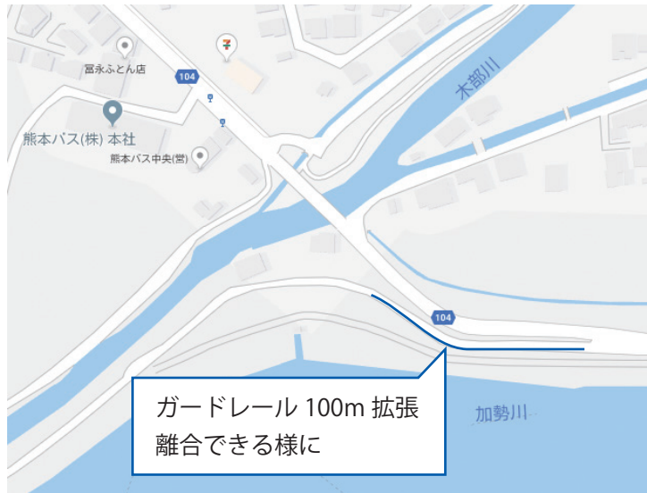
ガードレール 100m 拡張 離合できる様に